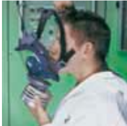
Coloque la barbilla en la mentonera