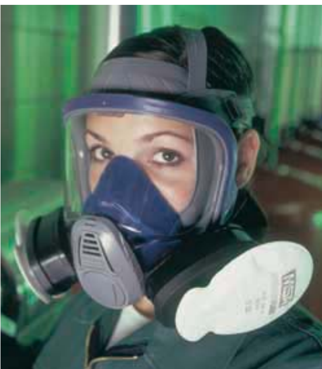
Advantage 3200 con TabTec® y FLEXIfilters

Las máscaras de la serie Advantage llevan los innovadores TabTec® y FLEXIfilters. Estos filtros protegen contra los gases tóxicos, vapores y partículas