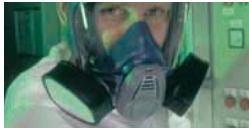
Advantage 3200 con filtro TabTec®

La vida útil de los filtros depende del ambiente de trabajo, el usuario y las condiciones de uso. Los filtros de gas deben ser sustituidos, como máximo,