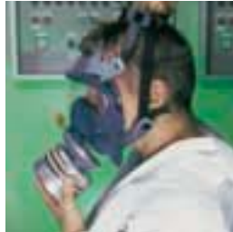
Deslice el arnés sobre la cabeza