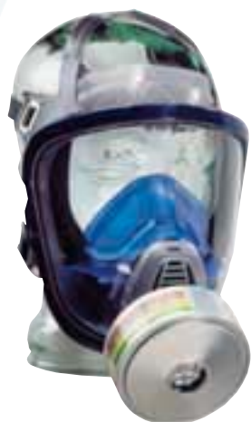
La Advantage 3000 está disponible con conexión para filtro EN 148 o doble conexión de filtros Advantage.

La Advantage 3000 es sencilla de manipular y puede colocarse con inigualable rapidez. Sosteniendo la máscara con un dedo, se coloca la barbilla en el área del mentón y se pasa el arnés sobre la cabeza. Después se ajustan las dos tiras del cuello. Si es necesario pueden ajustarse las tiras superiores, en general antes de la colocación por vez primera. El resultado es una rápida y sencilla colocación sin ningún pinzamiento del pelo. Incluso los hombres que tienen barba consiguen una mejor protección usando la Advantage 3000, puesto que el nuevo arnés Advantage patentado, garantiza siempre un correcto ajuste facial.