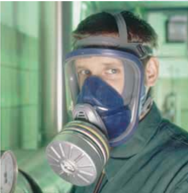
Advantage 3100 con Filtro de gas ABEK

Con las máscaras Advantage 3000 y la Advantage 200 LS y así mismo con la tecnología de filtración TabTec, MSA ha lanzado al mercado tres equipos distintos de protección respiratoria e implanta un avance tecnológico.