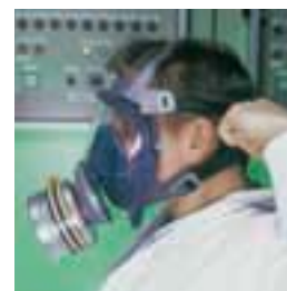
Ajuste las tiras