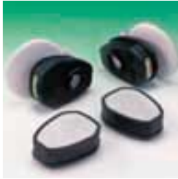
TabTec® con FLEXifilters