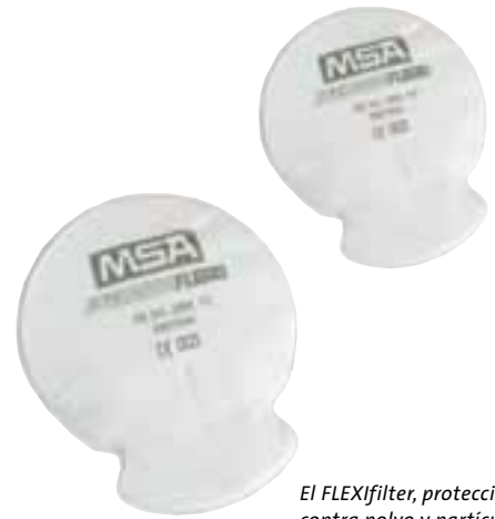
El FLEXifilter, protección contra polvo y partículas FLEXifilter

Los FLEXifilter son adecuados para aplicaciones donde existan aerosoles de partículas y olores. Puesto que los filtros caben holgadamente bajo las pantallas de soldador, se utilizan frecuentemente para esta aplicación.