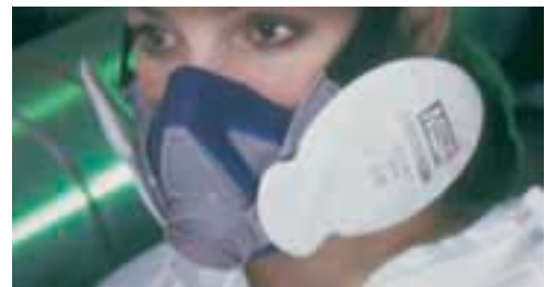
Advantage 200 LS con FLEXifilter

cuando se perciba olor, sabor o irritación al inhalar.