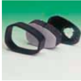
Detalle del filtro TabTec®