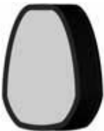
La nueva Tecnología Tab